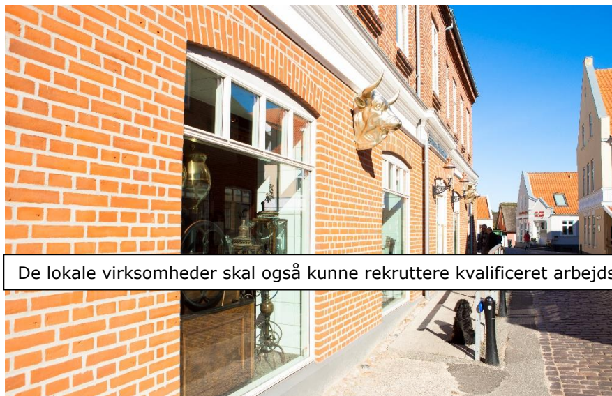
De lokale virksomheder skal også kunne rekruttere kvalificeret arbejdskraft fra fastlandet